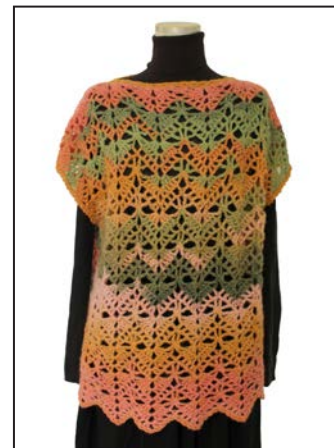
No.25-0557 トップダウンのジグザグベスト ジルダガルザート 901番 200g (1玉) 糸代 ¥3,600(税込¥3,960) デザイン 木之下 薫