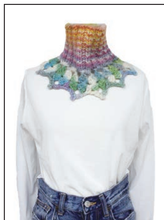
No.25-0559 ネックウォーマー カテーナマルチカラー 801番 50g (1玉) 糸代 ¥980(税込¥1,078) デザイン なわともし 『ニッティングスタイル』・見本帳