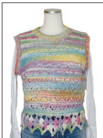
No.25-0558 模様編みのベスト カテーナマルチカラー 801番 210g (5玉) 糸代 ¥4,900(税込¥5,390) デザイン なわともし 『ニッティングスタイル』・見本帳