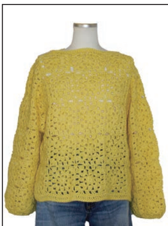
No.25-0554 モチーフつなぎのセーター スキークレア 6403番 510g (13玉) 糸代 ¥9,100(税込¥10,010) デザイン 澤田 みき 『ニッティングスタイル』・見本帳