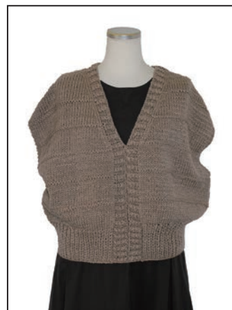
No.25-0553 棒針編みのベスト スキークレア 6408番 240g (6玉) 糸代 ¥4,200(税込¥4,620) デザイン coral 岡崎 優菜 見本帳