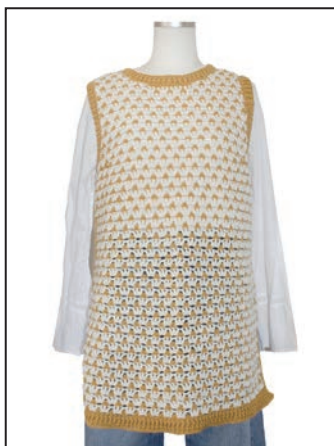
No.25-0551 かぎ針編みのロングベスト スキーカラル 7301番 170g(6玉)、7305番 190g(7玉) 糸代 ¥8,190(税込¥9,009) デザイン atelier tricot 小林真紀 見本帳