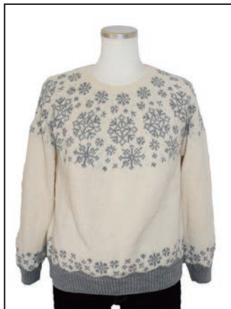
No.25-0550 丸ヨークのスノーフレックブル スキータスマニアンボロース 7002番 270g(7玉)、7026番 100g(3玉) 糸代 ¥7,800(税込¥8,580) デザイン 今井 泰子 『ニッティングスタイル』・見本帳