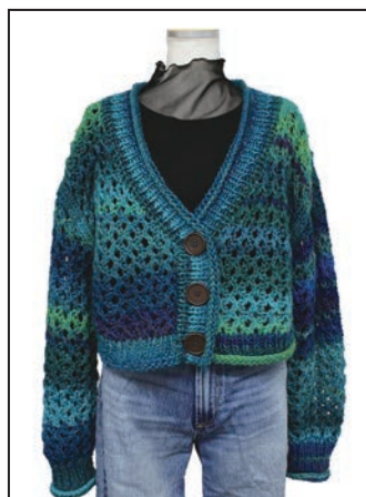
No.25-0560 ショート丈メッシュのカーディガン パイアッチョ 705番 290g (3玉) 糸代 ¥5,400(税込¥5,940) デザイン 小野 琇未 見本帳