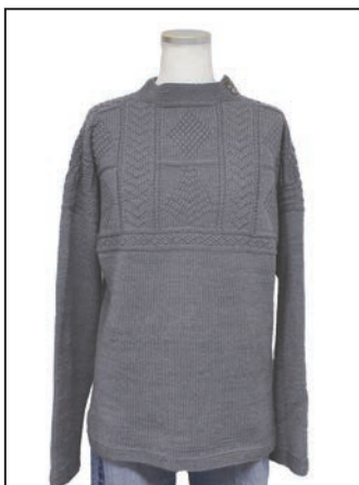
No.25-0552 ユニセックスガンジーセーター スキーカラル 7309番 390g (13玉) 糸代 ¥8,190(税込¥9,009) デザイン 佐倉編物研究所 伊藤 直孝 『ニッティングスタイル』・見本帳