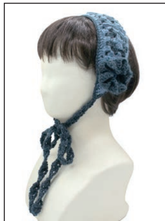
No.25-0555 イヤーマフ スキークレア 6406番 20g(1玉)、6410番 40g(1玉) 糸代 ¥1,400(税込¥1,540) デザイン 企画室 見本帳